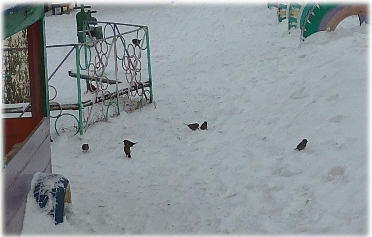
Фото посещения кормушек птицами при различных погодных условиях